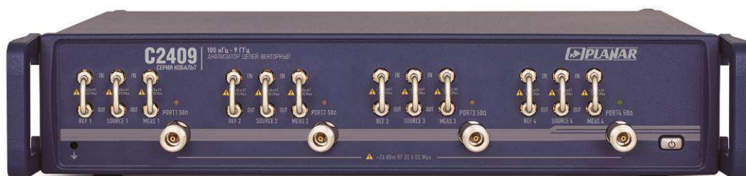
Рисунок 5 - Внешний вид анализаторов цепей векторных C2409