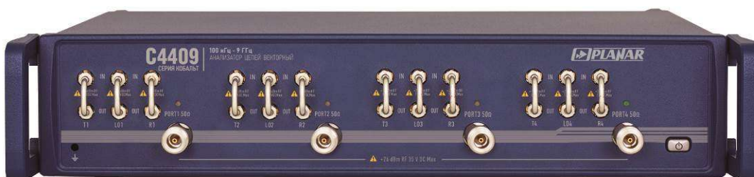
Рисунок 6 - Внешний вид анализаторов цепей векторных C4409