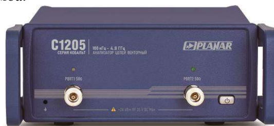
Рисунок 1 - Внешний вид анализаторов цепей векторных С1205 (С1207, С1209)

Внешний вид приведён на рисунках с 1 по 13. Маркировка включает общее для всех анализаторов цепей векторных наименование «серия Кобальт». Места для размещения наклеек приведены на рисунках 14 и 15. Место нанесения знака утверждения типа находится на наклейке, расположенной на задней панели. Функцию защиты от несанкционированного доступа выполняет гарантийная пломба.