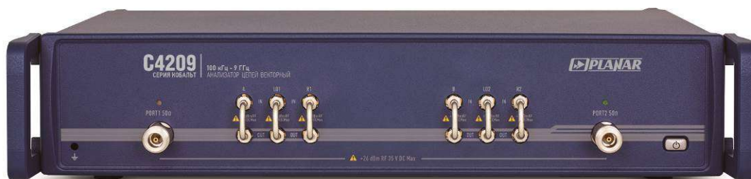
Рисунок 3 - Внешний вид анализаторов цепей векторных C4209