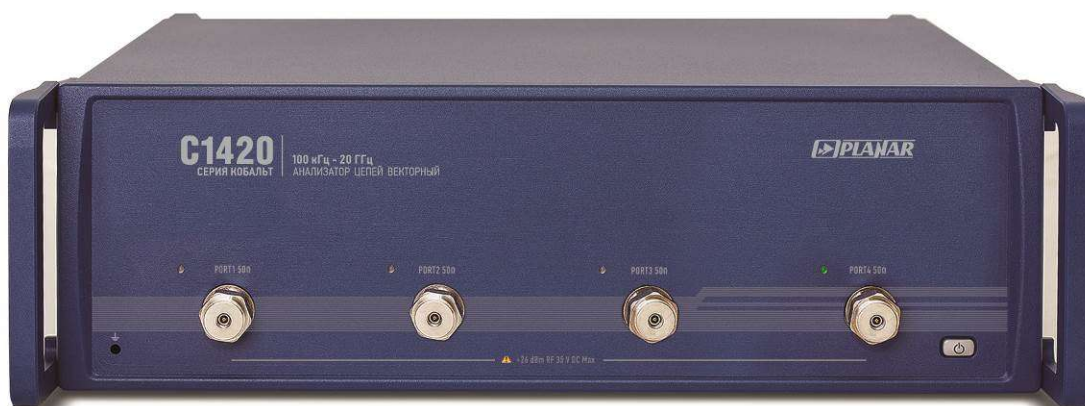
Рисунок 11 - Внешний вид анализаторов цепей векторных C1420