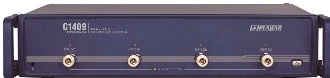
Рисунок 4 - Внешний вид анализаторов цепей векторных C1409