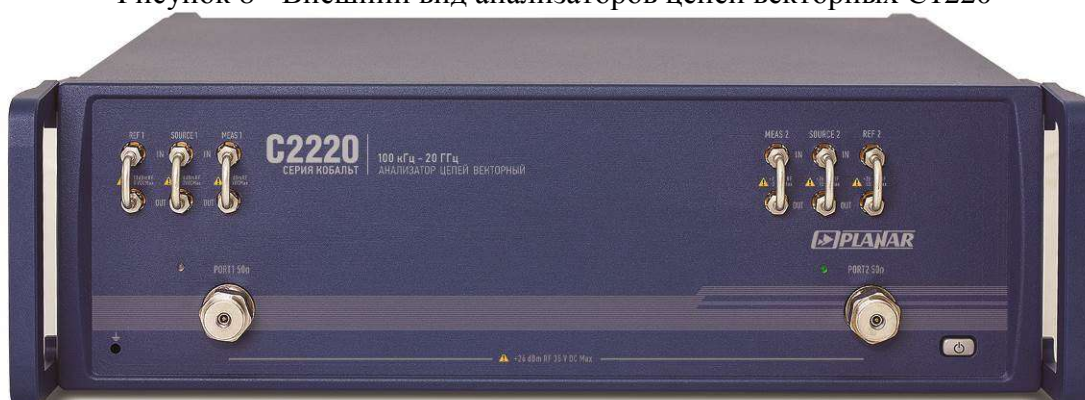
Рисунок 9 - Внешний вид анализаторов цепей векторных C2220