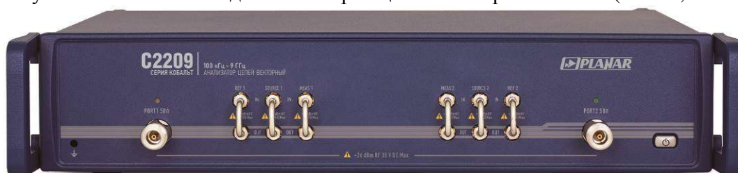
Рисунок 2 - Внешний вид анализаторов цепей векторных С2209