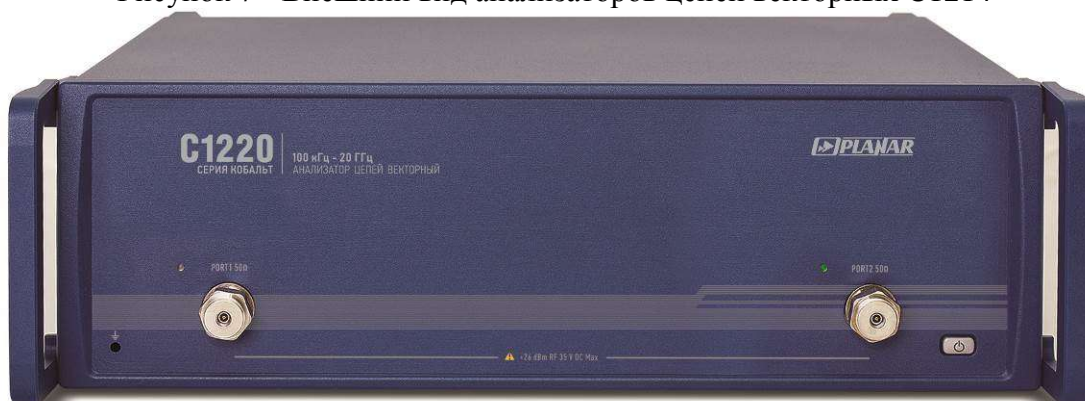
Рисунок 8 - Внешний вид анализаторов цепей векторных C1220