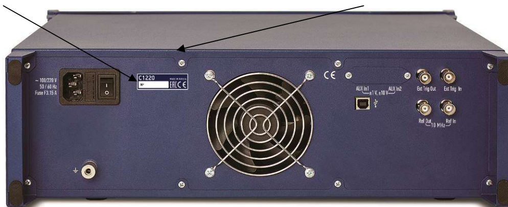
Рисунок 15 - Места для размещения наклеек на примере задней панели анализаторов цепей векторных C1220

Место нанесения знака утверждения типа Место пломбировки