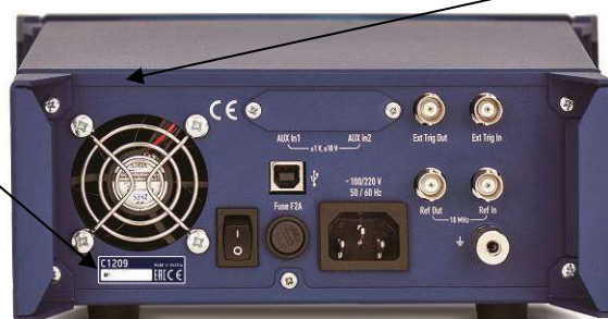
Рисунок 14 - Места для размещения наклеек на примере задней панели анализаторов цепей векторных C1209