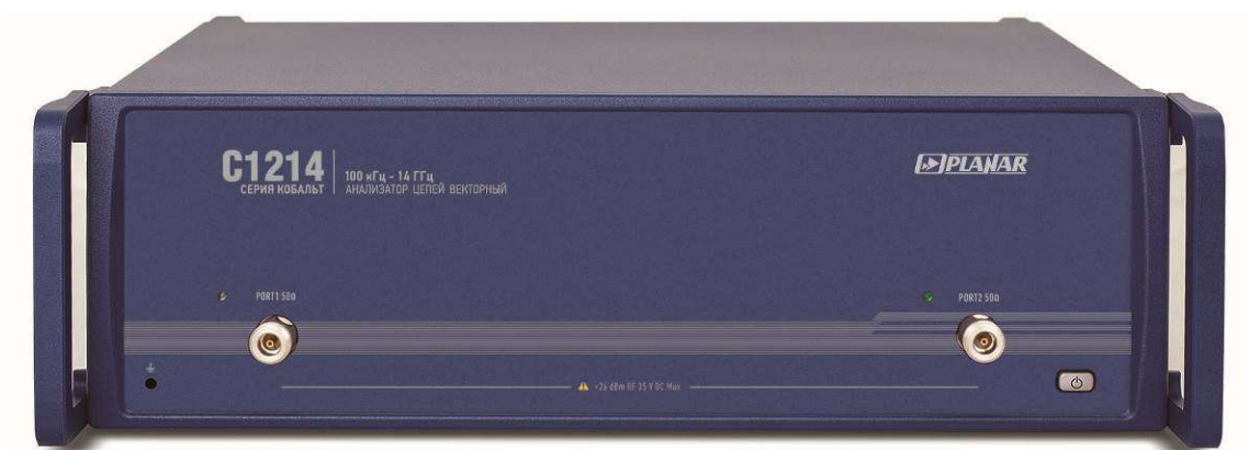
Рисунок 7 - Внешний вид анализаторов цепей векторных C1214